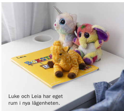
Luke och Leia har eget rum i nya lägenheten.