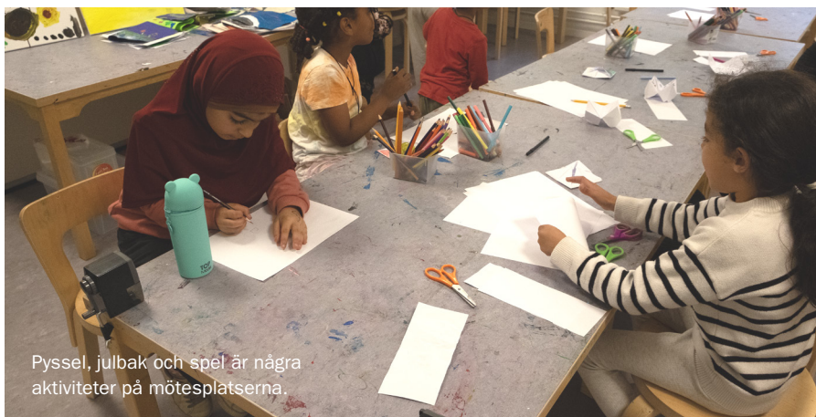
Pyssel, julbak och spel är några aktiviteter på mötesplatserna.

➔ Läs mer om alla Stockholms Stadsmissions mötesplatser: stadsmissionen.se/motesplatser