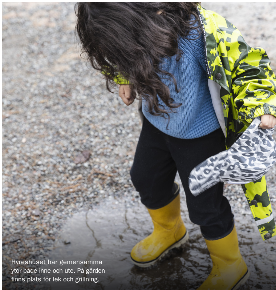
Hyreshuset har gemensamma ytor både inne och ute. På gården finns plats för lek och grillning.

– Jag ringde och fick prata med en tjej som sa att jag skulle höra av mig till Stockholms Stadsmissions bobyrå. Jag fick